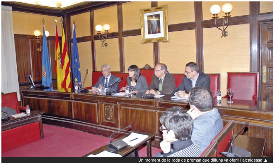
Un moment de la roda de premsa que dilluns va oferir l'alcaldesa ▲