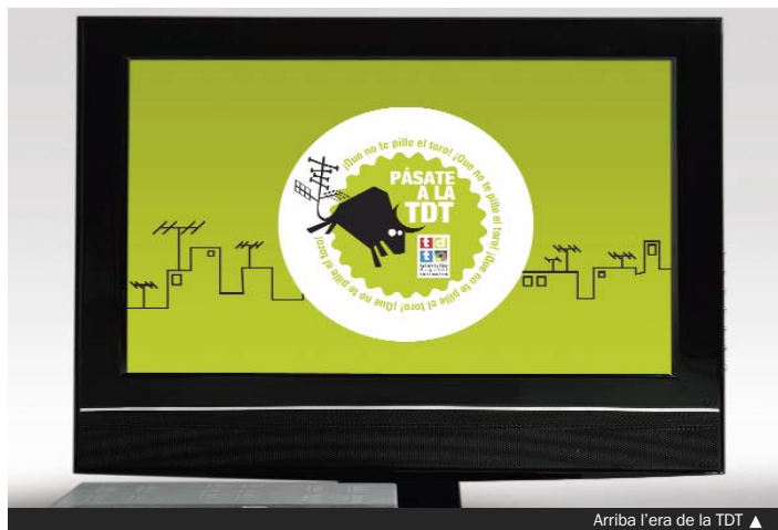
Arriba l'era de la TDT ▲