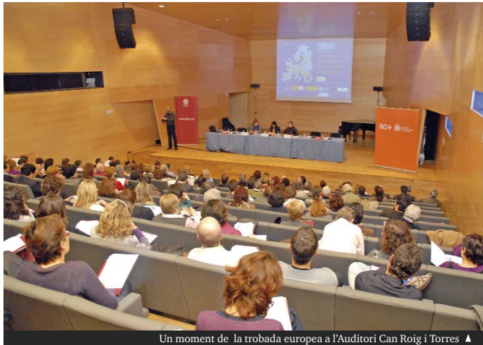
Un moment de la trobada europea a l'Auditori Can Roig i Torres ▲