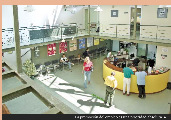
La promoción del empleo es una prioridad absoluta ▲