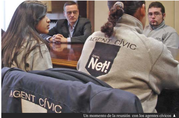
Un momento de la reunión con los agentes cívicos ▲

El objetivo es lograr la complicidad de las entidades para lograr, entre ambas partes, que mejore la limpieza de los espacios de la vía pública y prevenir las actuaciones incívicas que son objeto de infracción en las ordenanzas municipales.