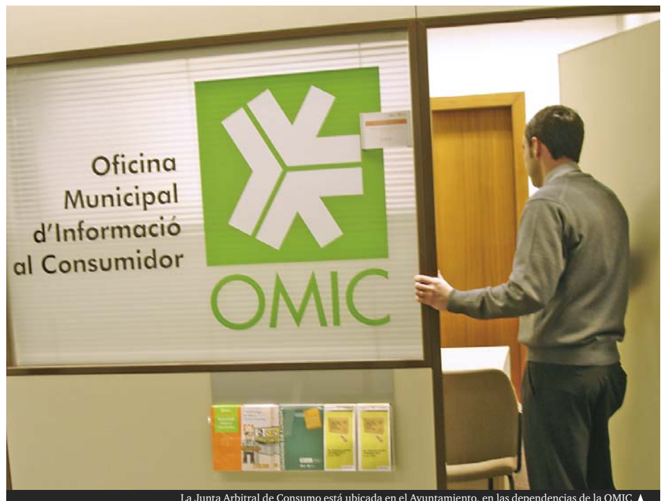
La Junta Arbitral de Consumo está ubicada en el Ayuntamiento, en las dependencias de la OMIC ▲

El arbitraje de consumo es un procedimiento extrajudicial de resolución de conflictos entre consumidores y establecimientos comerciales o empresas, en el cual un tercero, el órgano de arbitraje, decide la solución que debe adoptarse. La resolución arbitral tiene rango de