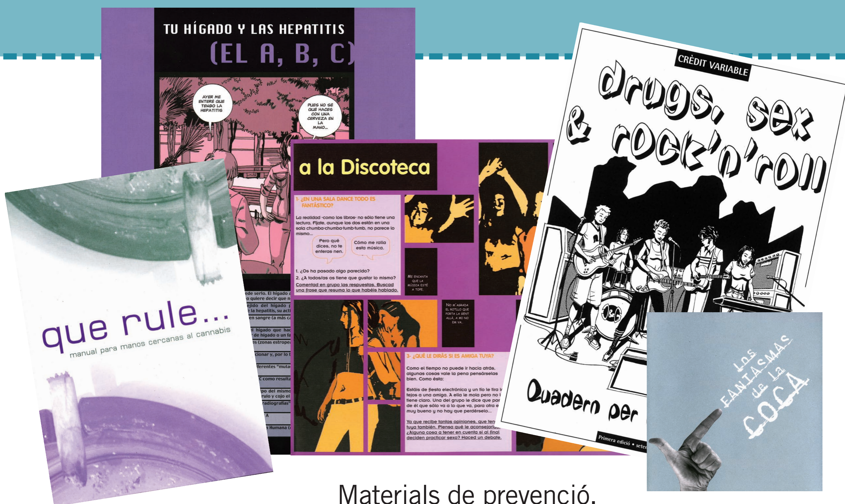
Materials de prevenció.