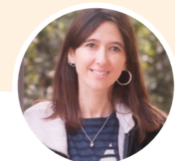
Núria Parlon Gil Alcaldesa de Santa Coloma de Gramenet