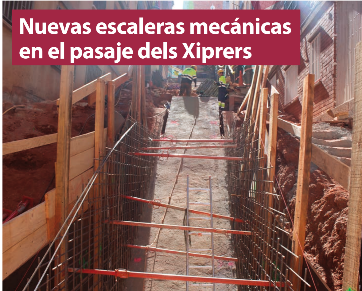
▲ Las nuevas escaleras mecánicas del pasaje dels Xiprers serán una realidad en breve.

La remodelación del pasaje dels Xiprers, con sus nuevas escaleras mecánicas, junto a las obras de mejora de distintas calles en la nueva campaña de asfaltado, marcan el pulso del distrito. La inversión a través del programa europeo EDUSI pretende cumplir con los compromisos del Plan de Acción Municipal (PAM), el Plan de Movilidad Urbana y Sostenible y el proyecto de Barrios para peatones.