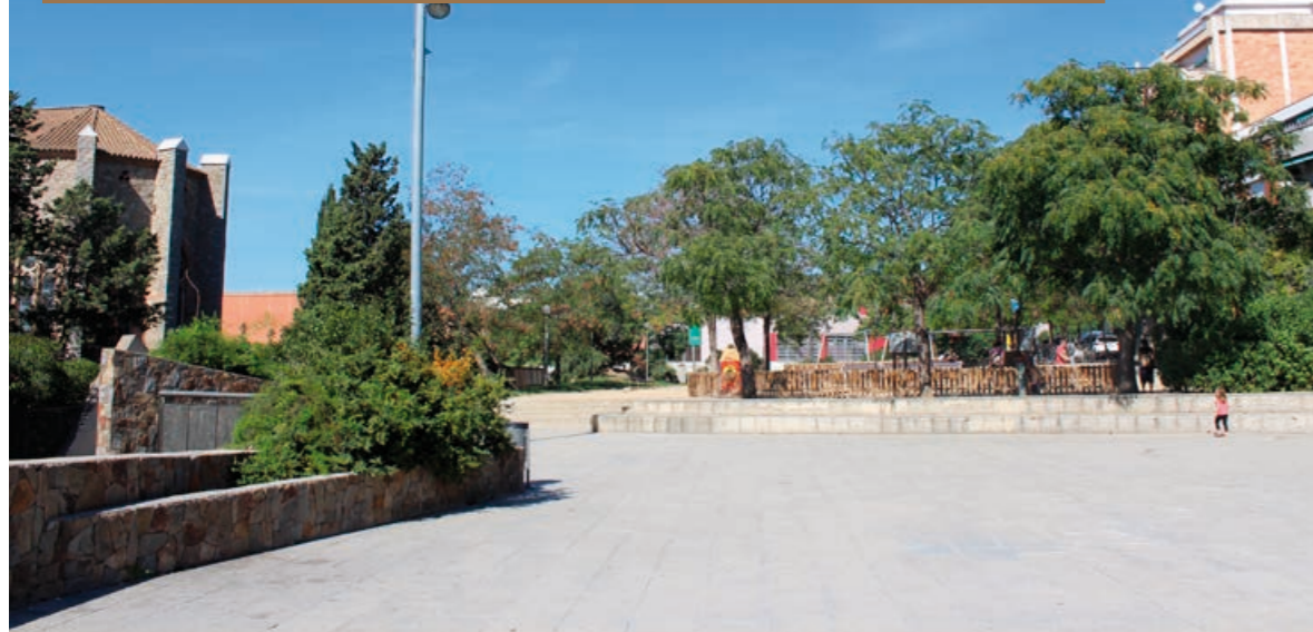
▲ Nuevo aspecto de la plaza Abad Escarré.

Las obras de reurbanización en Sant Lluís y Perú acaban mientras se impermeabiliza la plaza Escarré. Otras calles se incluyen en la nueva campaña de asfaltado, como la calle Sicilia, y marcan el pulso del distrito durante las próximas semanas. La inversión a través del programa europeo EDUSI pretende cumplir con los compromisos del Plan de Acción Municipal (PAM), el Plan de Movilidad Urbana y Sostenible y el proyecto de Barrios para peatones.