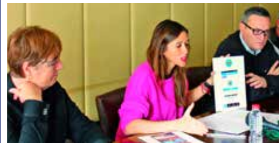
▲ L'alcalde va presentar les noves apps.

La tercera de les apps tindrà per objectiu aportar informació de valor sobre la ciutat i els seus serveis. L'app es dirà 'Santa Coloma és Smart', i aglutinarà informació en relació a diversos serveis de la ciutat, vinculats a la salut i la medicina, com per exemple els horaris dels CAPs o de les farmàcies, als aparcaments públics, al transport, amb els horaris de metro i bus, i també notícies d'actualitat del municipi, d'agenda, una guia de telèfons d'interès, així com les programacions de l'Auditori i del Teatre.