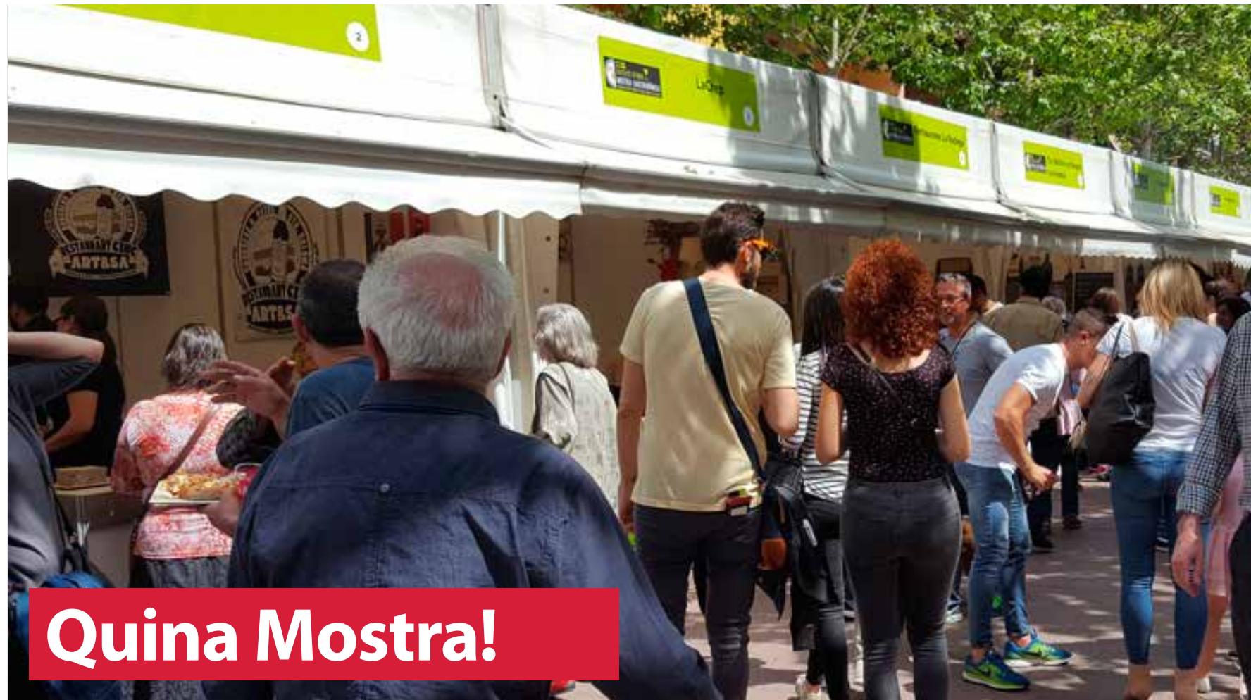
▲ Visitants de la Mostra el dissabte al matí

Tres jornades de conversa diversió i bon menjar i beure van omplir la Rambla de Sant Sebastià els dies 20, 21 i 22 d'abril en el que es pot qualificar de tot un èxit de la Mostra Gastronòmica de Santa Coloma. Una trentena de parades dels nostres restauradors i vinaters amb propostes que demostren la varietat i qualitat de la gastronomia colomenca i que impulsen i projecten Santa Coloma com a referent de ciutat gastronòmica a l'Àrea Metropolitana de Barcelona.