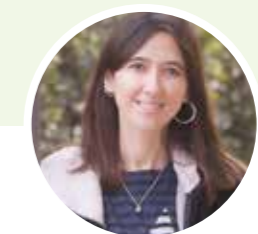
Núria Parlon Gil Alcaldesa de Santa Coloma de Gramenet

Pensant en les persones, al costat dels veïns i veïnes, treballem per millorar el present i projectar el futur. Les regidories de districte són una d'aquestes eines de proximitat i de millora. Atenem els vostres problemes i recollim els vostres suggeriments per fer la millor ciutat entre tots i totes.