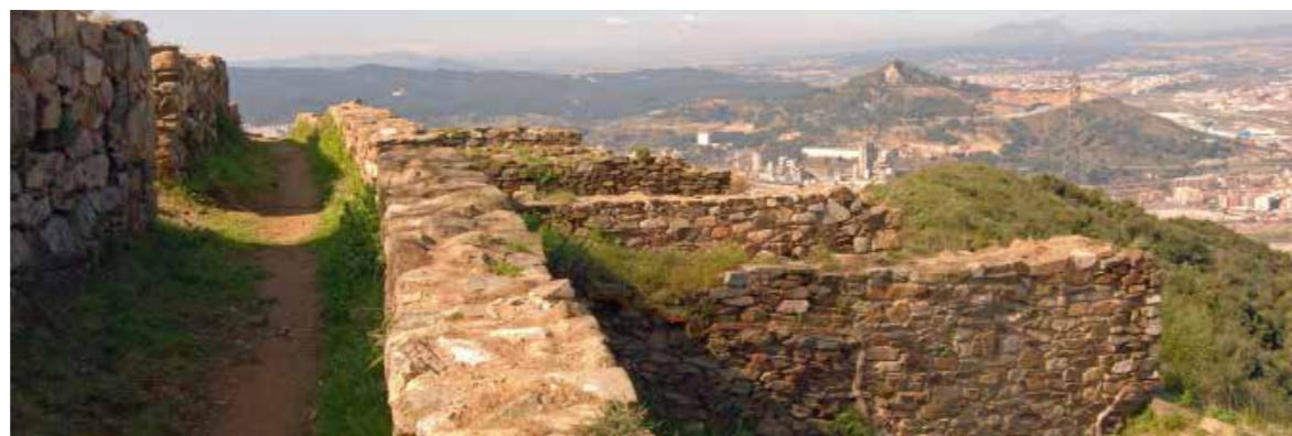
▲ Restes dels murs d'algunes cases del poblat.

La seva ubicació privilegiada permetia als seus habitants el control de part del riu Besòs, mantenint el contacte visual