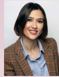
Núria Parlon Gil Alcaldessa de Santa Coloma de Gramenet

El parc d'Europa es va convertir en aparador d'aromes i sabors amb la Mostra Gastronòmica, un esdeveniment molt especial que hem tornat a celebrar a la ciutat i que forma part de la 'Primavera Gastronòmica', amb la qual estem desplegant diferents iniciatives amb l'objectiu de fer suport al sector de la restauració local. La Mostra va ser un punt de trobada cultural i gastronòmic d'èxit en què vam poder descobrir i redescobrir el talent, la qualitat i la diversitat de les propostes culinàries dels establiments participants. Com a alcaldessa de Santa Coloma de Gramenet, m'omple d'il·lusió el