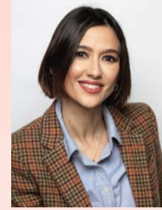
Núria Parlon Gil Alcaldeessa de Santa Coloma de Gramenet

El parc d'Europa es va convertir en un aparador d'aromes i sabors amb la Mostra Gastronòmica, un esdeveniment molt especial que hem tornat a celebrar a la ciutat i que forma part de la 'Primavera Gastronòmica', amb la qual estem desplegant diferents iniciatives amb l'objectiu de fer suport al sector de la restauració local. La Mostra va ser un punt de trobada cultural i gastronòmic d'èxit en què vam poder descobrir i redescobrir el talent, la qualitat i la diversitat de les propostes culinàries dels establiments participants. Com a alcaldessa de Santa Coloma de Gramenet, m'omple d'il·lusió el