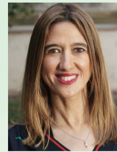
Núria Parlon Gil Alcalde de Santa Coloma de Gramenet

El programa de proximitat de les regidories de districte continua en marxa amb més força que mai i amb l'objectiu de reforçar l'atenció directa als veïns i les veïnes des dels barris. Els regidors i regidores de districte no han deixat d'atendre els ciutadans i les ciutadanes durant aquesta pandèmia i ara, més que mai, treballaran als districtes, per escoltar i aportar solucions als problemes i necessitats plantejades per la ciutadania. Es tracta d'una labor cabdal en favor de la qualitat democràtica, la descentralització de la participació ciutadana i la igualtat d'oportunitats dels colomencs i les colomenques.