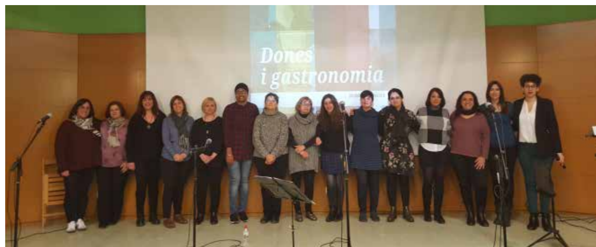
▲ Presentació del calendari de les dones 2018.

Aquestes dones, amb la seva participació al calendari, demostren que, des del món de la gastronomia, treballen i lluiten cada dia per la igualtat. Elles mateixes es defineixen, amb certeses i contradiccions, com a valentes, lluitadores, solidàries, empenedores, lliures... però sobretot com a dones, joves i diverses.