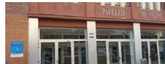
▲ Entrada del Pavelló Nou.

El Pavelló Nou comença a no ser tan "nou". De fet, l'Ajuntament ja ha fet millores a la pista i a la grada i ara treballa en l'adequació i millora de la coberta i la façana. En concret, es treballa per a renovar el sistema de recollida d'aigües pluvials de la seva coberta (en el canal nord-est) amb una inversió de 60.457 €, per tal de reparar i optimitzar la recollida d'aigua pluvial i evitar danys a la coberta i les façanes de l'edifici. Actualment el pavelló compta amb una capacitat de 1.275 persones assegudes. Però els èxits de l'esport colomenc han fet que actualment s'estudii una ampliació de localitats. Aquestes obres es desenvoluparan previsiblement fins al 2020.