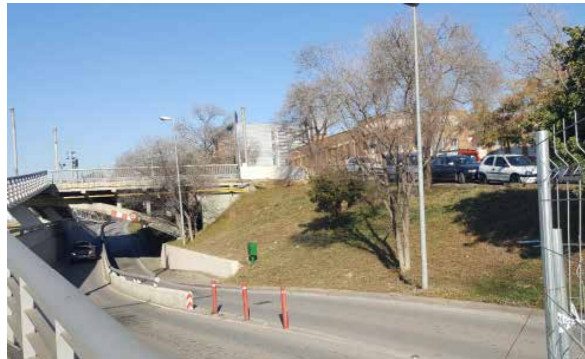
▲ Estat actual del pas inferior sota el pont que desapareixerà amb la remodelació.