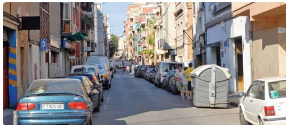
Carrer de la Cultura, des del pg. de la Salzerada Calle de la Cultura, desde el ps. de la Salzerada

Se renovará todo el alumbrado de la zona, con la instalación de 32 faros que siguen a un modelo de consumo responsable sin que disminuya la calidad de la iluminación en esta vía.