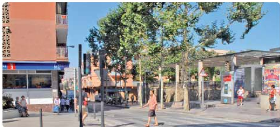
Carrer de la Cultura i plaça de Catalunya Calle de la Cultura y plaza de Catalunya