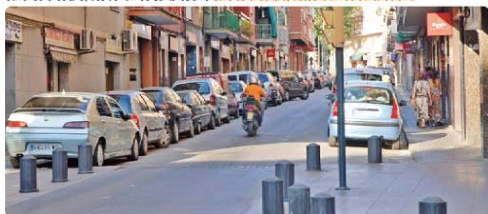
Carrer de la Cultura, des de l'av. de Santa Coloma Calle de la Cultura, desde la av. de Santa Coloma

El proyecto de reurbanización de la calle de la Cultura, con los nuevos elementos y mobiliario urbano, está pensado para aumentar su calidad y funcionalidad. Convertir en "plataforma única" el tramo comprendido entre la calle de Sant Carles con la avenida de la Generalitat es para que los peatones mejoren sus desplazamientos y movilidad, y para disminuir la velocidad de los vehículos. En el resto de la calle se pavimentarán aceras y calzadas a diferente nivel con materiales de larga duración.