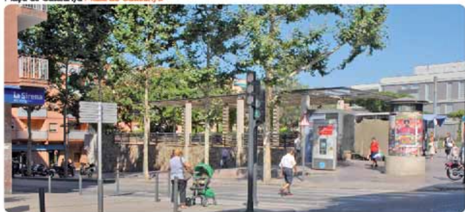
Plaça de Catalunya Plaza de Catalunya

El proyecto de mejora de esta emblemática plaza del barrio del Riu Sur incluye la renovación de los juegos infantiles, 62 nuevos bancos, 8 nuevas papeiras, una fuente, , la instalación de una barandilla para proteger a los peatones del desnivel con la calle de Sant Carles y la renovación del césped y del pavimento en todos aquellos puntos que se han deteriorado desde su construcción, entre otros aspectos.