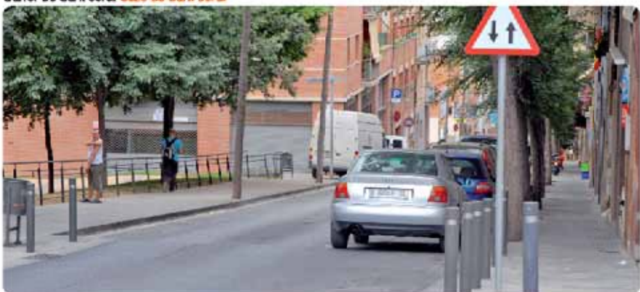
Carrer de Sant Jordi Calle de Sant Jordi

El proyecto de mejora de la calle de Sant Jordi supone una superficie de actuación de 2.820 m 2 . Las aceras de cada lado de la calle serán de diferente longitud; por una parte, habrá una acera de 1,8 metros y otra de 2,7 metros que es donde se ha planteado la plantación de árboles. Habrá un camino de circulación de vehículos de 3,5 metros de amplitud y una línea de aparcamiento de dos metros. En conjunto, está planteado para mejorar los desplazamientos de los peatones y a la vez aumentar la calidad del espacio público.