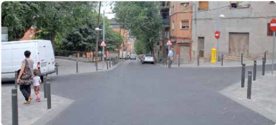
Crulla del carrer de Sant Jordi amb el carrer d'Ecano Cruce de la calle de Sant Jordi con la calle de Ecano

El projecte de millora del carrer de Sant Jordi suposa una superfície d'actuació de 2.820 m 2 . Les voreres de cada cantó del carrer seran de diferent longitud; per una banda, hi haurà una vorera de 1,8 metres i una altra de 2,7 metres que és on s'ha plantejat la plantada d'arbres. Hi haurà un camí de circulació de vehicles de 3,5 metres d'amplitud i una línia d'aparcament de dos metres. En conjunt, l'espai està plantejat per millorar els desplaçaments dels vianants i alhora augmentar la qualitat de l'espai públic.