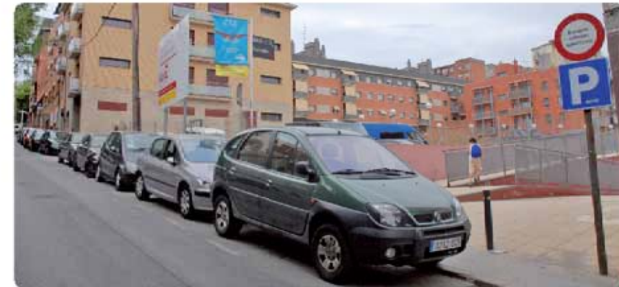
El barri guanyarà un nou espai públic El barrio ganará un nuevo espacio público

Estamos iniciando un proyecto de remodelación de diferentes vías en diferentes barrios, para mejorar la ciudad y sobre todo la calidad de vida de la ciudadanía. Para conseguir este objetivo, es necesario la colaboración de vecinos y vecinas, mediante sugerencias y aportaciones. Porque su opinión es importante para, entre todos y todas, hacer una Santa Coloma mejor.