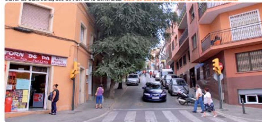
Carrer de Sant Jordi, des de l'av. de la Generalitat Calle de Sant Jordi, desde la av. de la Generalitat

Las obras para la nueva urbanización de la calle de Sant Jordi y de creación de la nueva plaza está previsto que empiecen durante el mes de septiembre y tendrán una duración aproximada de 3 meses. Durante este tiempo la entrada y salida de vehículos estará restringida con control horario pero se facilitará el acceso a los aparcamientos particulares en la medida de lo posible así como los vehículos que por necesidad tengan que acceder y/o salir de las oficinas de la Policía Local. Se desviarán las líneas de autobuses B18, B21, B30, B31 y la 801. El Ayuntamiento pide precaución y disculpas a los vecinos y a las vecinas por las posibles molestias que se puedan causar.