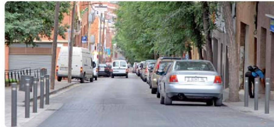
Carrer de Sant Jordi, des del carrer d'Ecano Calle de Sant Jordi, desde la calle de Ecano

Está prevista la plantación de 36 árboles ("Koelreuteria paniculata"), 26 en el recorrido de la calle y 10 en la nueva plaza.