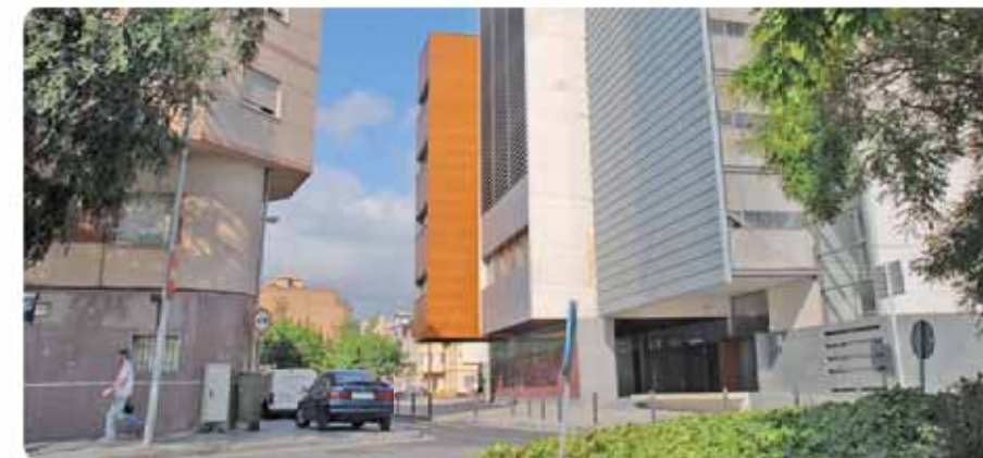
Plaça d'en Baró, amb l'edifici dels jutjats Plaza de Baró, con el edificio de los juzgados