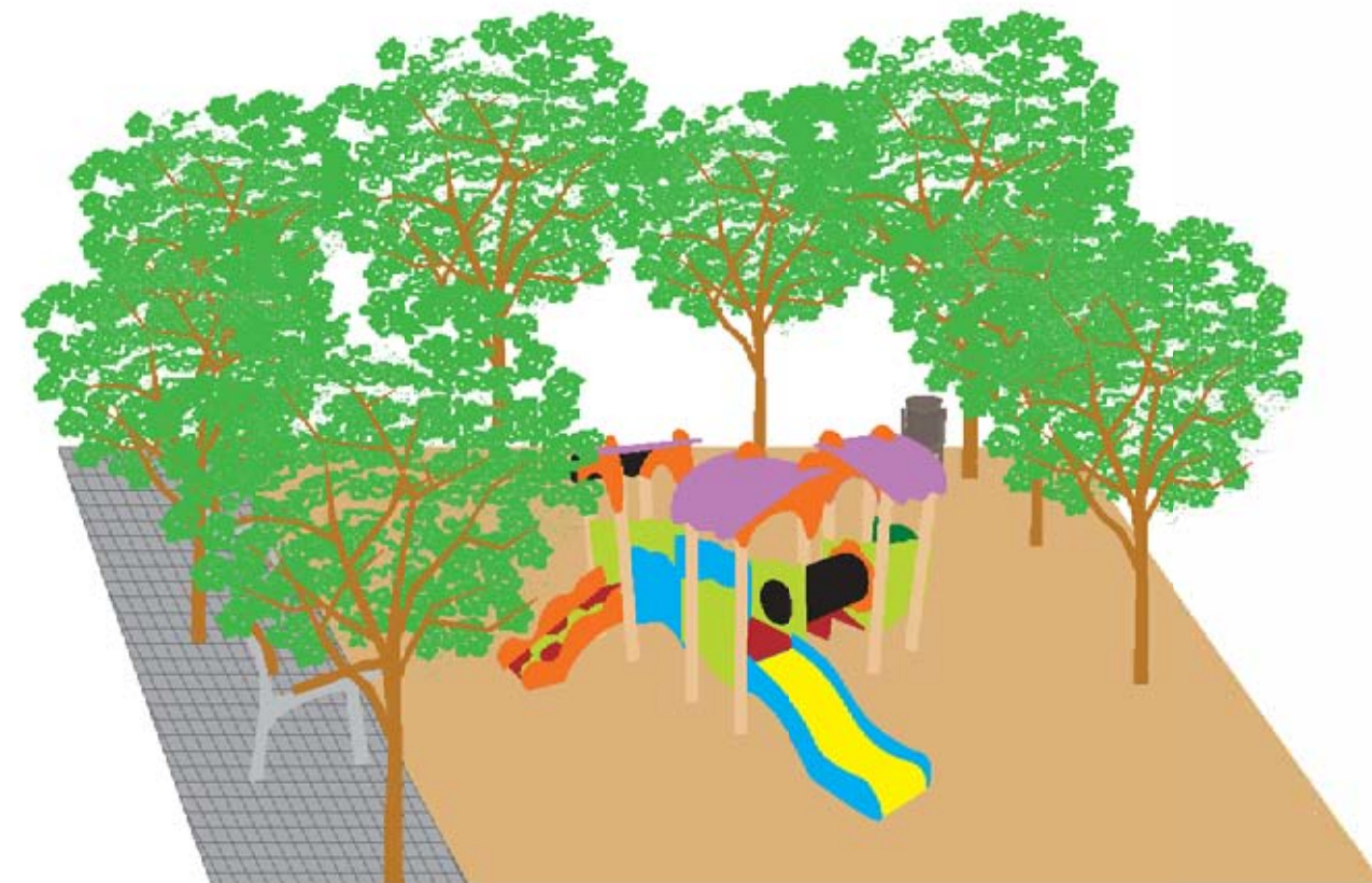
Imagen en perspectiva de un detalle de la nueva plaza, con los juegos infantiles, árboles, papeleras y bancos