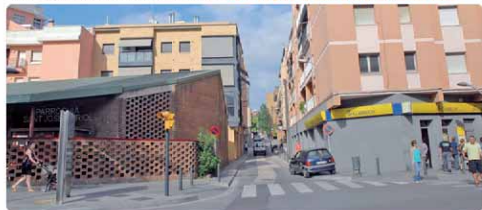
El carrer Major, a la cruïlla amb l'av. de Francesc Macià La calle Major, en el cruce con la av. de Francesc Macià

La urbanización de la calle de Mayor se divide en dos partes. Por una parte, el tramo comprendido entre la avenida de Francesc Macià y la calle de Sant Carles, que pasará a ser de plataforma única. Por otra parte, el tramo que hay entre las calles de Sant Carles y Rafael Casanova, donde se sustituirá el pavimento de la acera y se hará una nueva plaza.