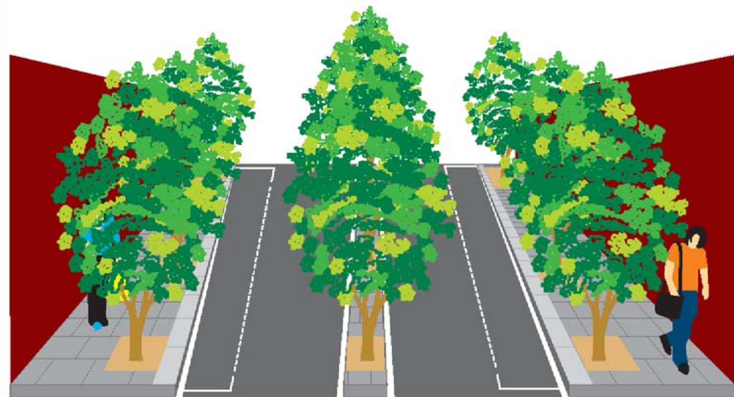
Imagen en perspectiva de una sección de la calle.