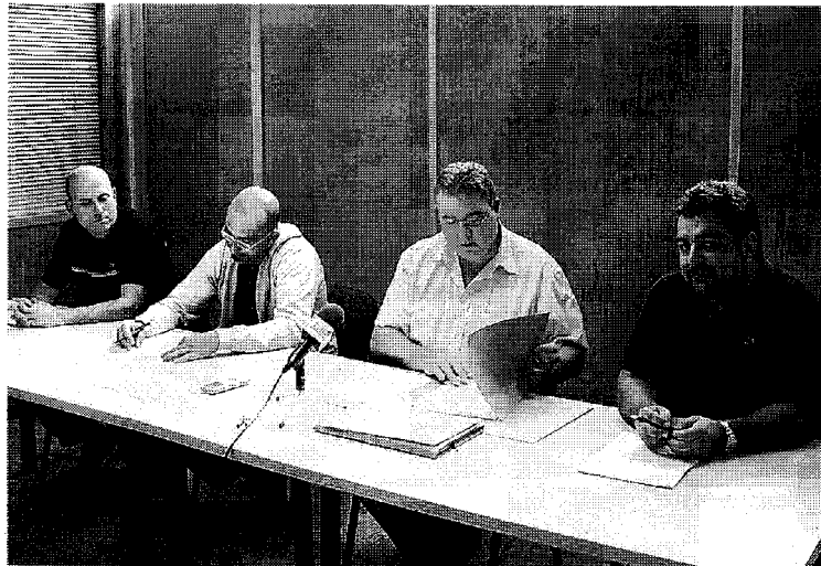
Imatge de la plataforma de veïns que es va presentar ahir a Badalona. / A. BENET

Admeten que no s'han adreçat a l'Ajuntament, a qui acusen d'actuar d'esquena als veïns. Aquesta reacció és fruit de la reserva d'un terreny municipal de 1.200 m 2 per a usos religiosos, a prop de la B-20, que es va aprovar en el ple municipal del juliol. Pa-