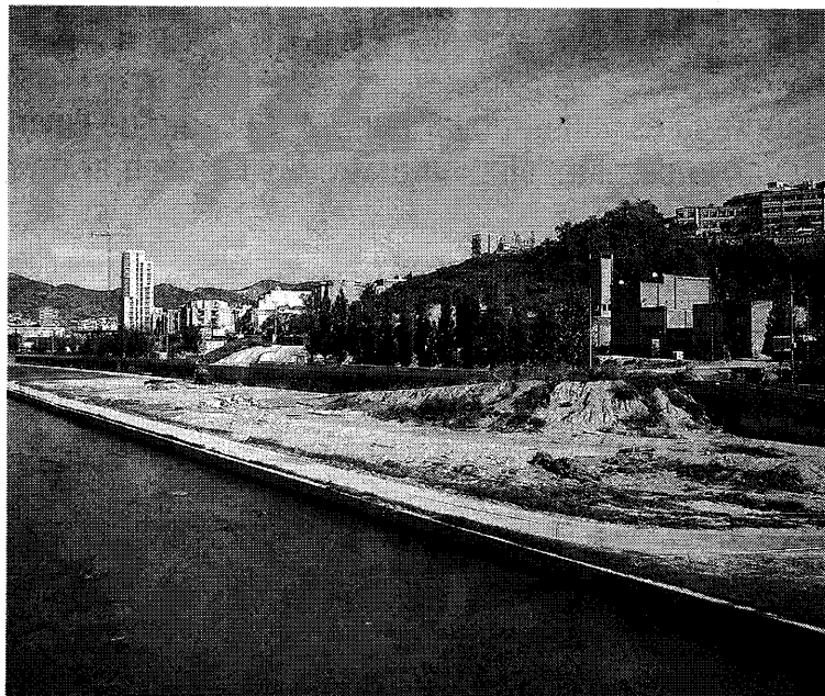
Imatge de la façana fluvial del Besòs que voreja els Safaretjos i el Molinet.

Segons l'acord entre les administracions, l'Institut Català del Sòl (Incasol) redactarà el planejament d'aquesta part del barri dels Safaretjos i basant-se en les futures qualificacions urbanístiques s'elaboraran els projectes corresponents. Sembla clar, però, que l'actuació inclourà habitatges de protecció pública. Encara, però, no se sap quants pisos es faran ni en quin tram de la façana fluvial és renovarà. En aquest sentit, la ti-