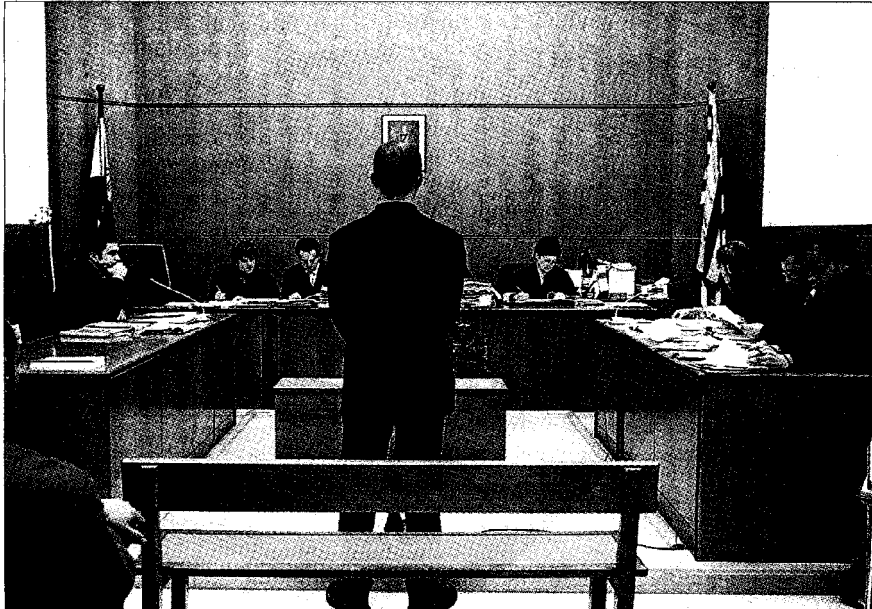
El acusado, durante el juicio celebrado ayer en la Audiencia de Barcelona.