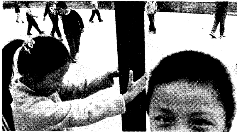
La mitad de los 17.000 vecinos que habitan en el Fondo procede de lejos de Europa, principalmente de China