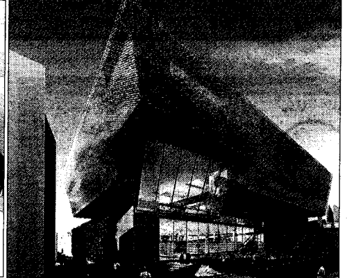
Dos vistas de las fachadas del nuevo edificio multifuncional de Fondo según una recreación virtual. sc+

El nuevo edificio también albergará en su interior calles y plazas, funcionando como conector y articulando un itinerario pacificado por escaleras mecánicas, ascensores y