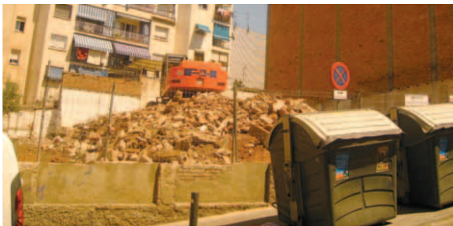
Imatge dels primers enderroc de quatre finques del carrer Bruc.

El desplegament del projecte s'està executant d'acord amb el calendari previst.