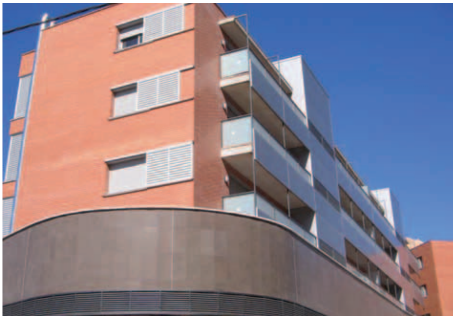
Les promocions de Pirineus (GRAMEPARK) i Anselm de Riu (REGESA) acullen el primer grup de reallotjaments.