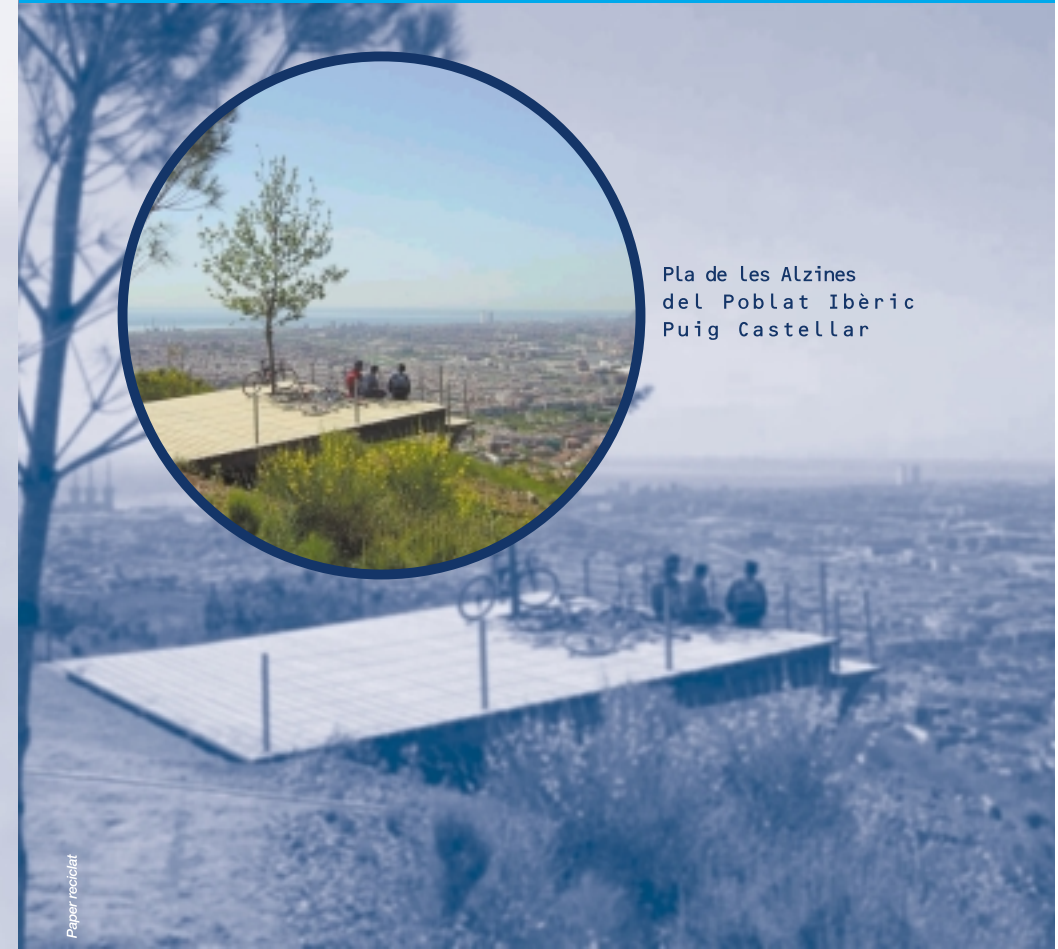
Pla de les Alzines del Poblat Ibèric Puig Castellar

PROGRAMA DE RESTAURACIÓ D'ÀREES PERIURBANES I FONTS NATURALS RECONEGUT PEL COMITÈ HÀBITAT DE NACIONS UNIDES