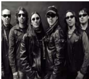
ROCK & RÍOS BAND

La plaça del Relloige no tanca per a la Festa: música i ritme non-stop.