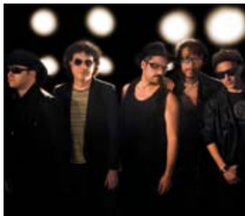
LOS 80 PRINCIPALES