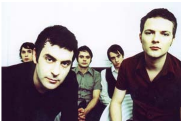
LA HABITACIÓN ROJA