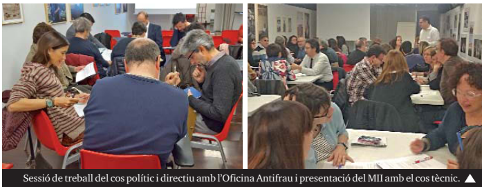
Sessió de treball del cos polític i directiu amb l'Oficina Antifrau i presentació del MII amb el cos tècnic. ▲

Els garibé 200 candidats que opten a formar part del Consell són nens i nenes de 9 i 10 anys. Seran consellers i conselleres durant dos cursos i treballaran en plenari i en comissions temàtiques (tots plegats en decidiran l'àmbit). De comissions n'hi haurà tres, que representen les tres zones escolars en què s'ha dividit la ciutat.