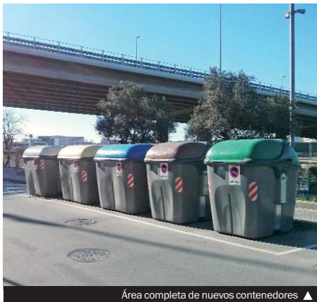
Área completa de nuevos contenedores ▶

Los nuevos contenedores grises están fabricados con materiales ligeros, tienen una capacidad de 3.200 litros, son resistente a la corrosión, las heladas, el calor, y los productos químicos, y su forma facilita el mantenimiento y la limpieza periódica. Entre otras mejoras, el nuevo modelo dispone de un elemento táctil identificativo que puede ser reconocido por invidentes. Construido con apertura de la tapa de gran capacidad, se ubica al lado de la acera para la entrada de residuos mediante pedal; este permite dos posiciones, desde la acera y la calzada, aunque está preparado para colocar una maneta que permita abrir la tapa de forma manual. En este sentido, el Ayuntamiento, de acuerdo con CEMFIS, la entidad local que trabaja en defensa de las